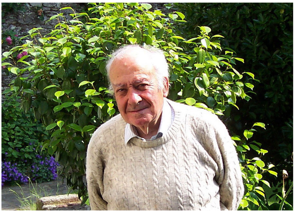
Figure 2. The late Breton linguist Per Denez at his home at St-Benoît-des-Ondes, Brittany, June 2005.