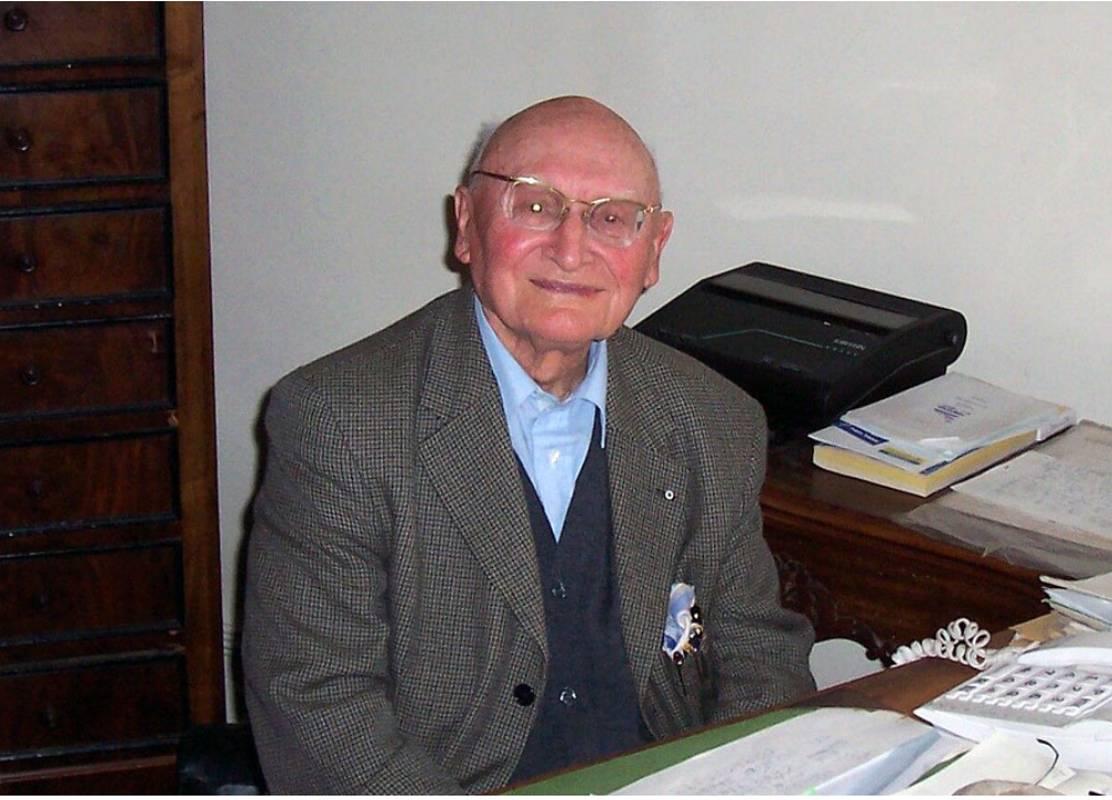
Figure 3. The late Breton historian and autonomist Yann Fouéré in his study at St.-Brieuc, Brittany, June 2005.